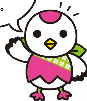
鶴見区マスコットキャラクター 「つるりっぶ」